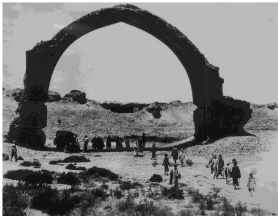
تاق بست (تاق بست)

آثار غزنویان: لشکری بازار که در آن تاق بُست موجود می باشد. این قوس در حدود ۲۷ متر وایه که به گمان اغلب جهت این قوس به جانب یک ساختمان و یا مسجد که فعلاً موجود نیست میباشد. این