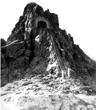
صحنه زینه کهنه در

بخشی از کتاب مفتاح الحساب نوشته جمشید کاشی ریاضیدان و منجم عصر تیموری، به معماری