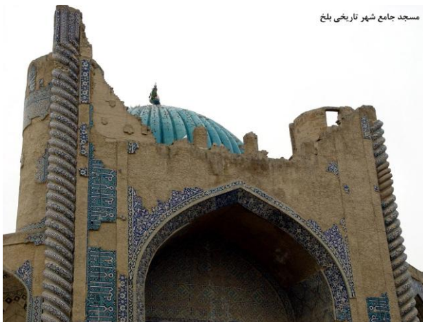
مسجد جامع شهر تاریخی بلخ

معماری اسلامی، شیوه‌ای از معماری است که تحت تأثیر فرهنگ اسلامی بوجود آمده و دارای ویژگی‌های خاص خود می‌باشد. معماری کشورهای اسلامی تحت تأثیر ایدئولوژی اسلام در طول